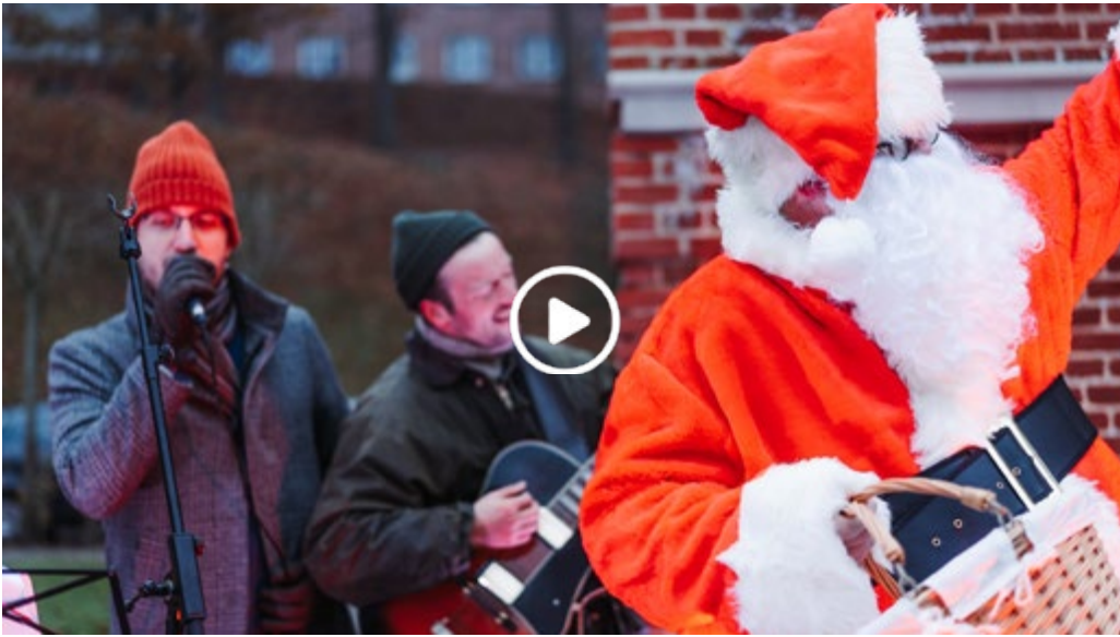
En uforglemmelig oplevelse med grin, glæde og festligheder.