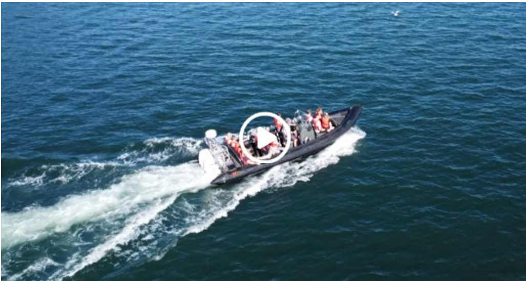
Fantastisk sommeroplevelse på Kolding fjord

"Meget tilfredse med jeres arbejde før og under afvikling. I virkede troværdige fra start og passionerede omkring det I går og laver. Det smitter i den grad. Vi var ikke utrygge på noget tidspunkt i forløbet Vi vil helt sikkert bruge jer igen ved en anden lejlighed."